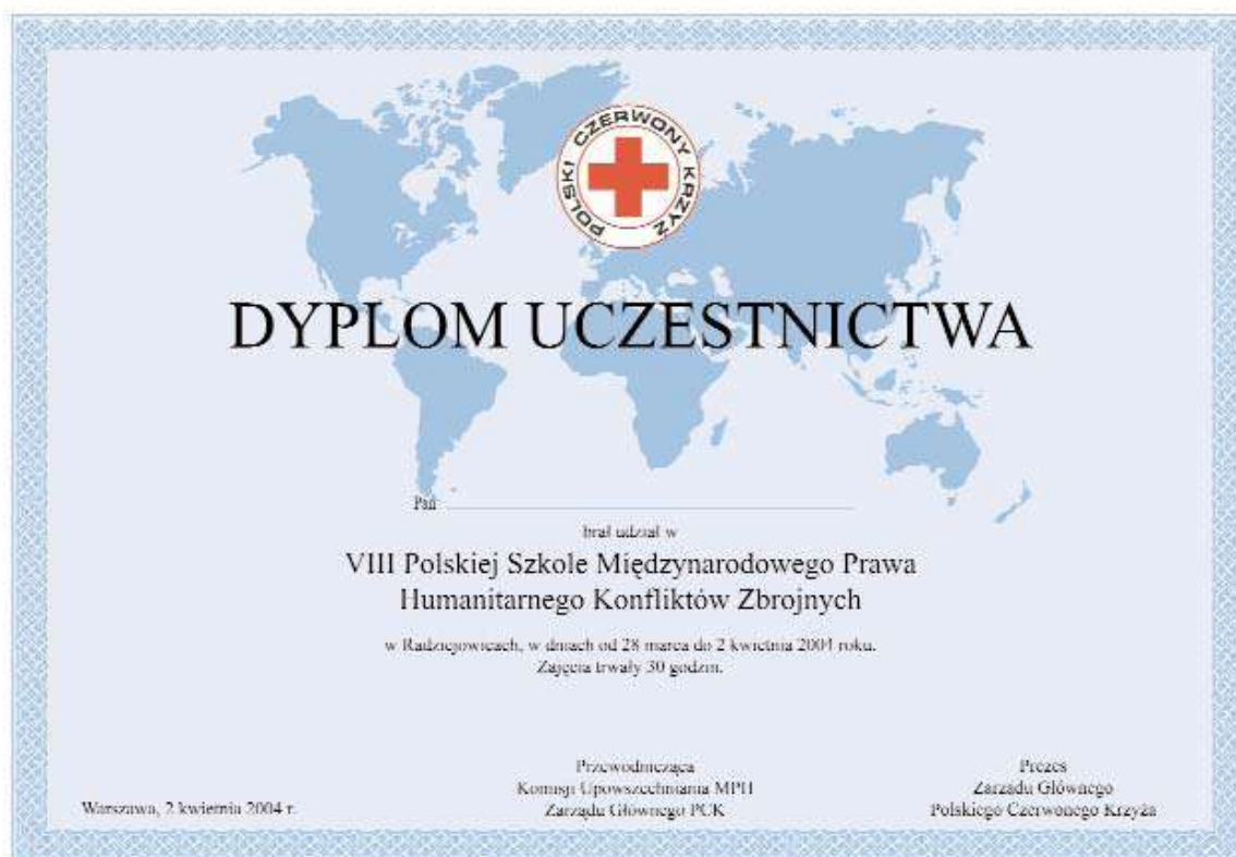
Rys. Dyplom polskiej szkoły prawa humanitarnego

Na dowodach uznania powinien znaleźć się napis „Polski Czerwony Krzyż” oraz, jeżeli to możliwe, krótka informacja dotycząca znaczenia dowodu uznania lub rodzaju zasługi, za którą został przyznany. W tych sytuacjach forma graficzna nie jest dokładnie określona. (Regulamin art. 5 akapit 3 i art. 26). Znak informacyjny powinien w miarę możliwości być umieszczony razem ze wzorem dekoracyjnym.