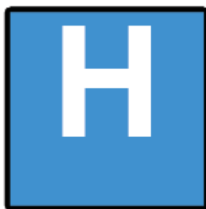
E13a - Szpital

Użycie tych dwóch znaków jest wyjątkiem wobec generalnego zakazu używania znaku czerwonego krzyża zawartego w konwencjach genewskich. W poprzedniej konwencji o znakach drogowych z 1949 roku znak D-22 dotyczył tylko punktów opatrunkowych prowadzonych przez stowarzyszenie krajowe Czerwonego Krzyża. Następną konwencją z 1968 roku usunęła fragment przepisu o stowarzyszeniu krajowym, rozszerzając tym samym prawo do posługiwania się znakiem na wszystkie punkty opatrunkowe. O ile w przypadku znaku D-22 sytuacja jest jasna, to znak D-21 „szpital” można zastąpić innym znakiem dopuszczonym przez konwencję o ruchu drogowym z 1968 roku. Poniższy znak również oznacza, iż w pobliżu znajduje się szpital.