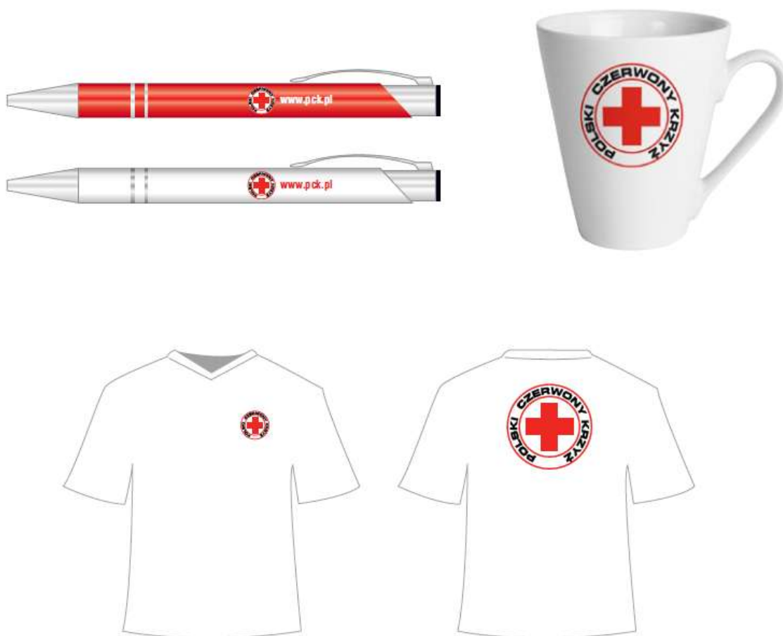
Rys. Właściwie użycie znaku

Przy projektowaniu tego typu materiałów należy pamiętać, aby umieszczony na nich znak nie mógł być pomyłony ze znakiem w znaczeniu ochronnym.