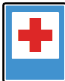
D-22 - Punkt Opatunkowy

Rys. Znaki zgodne z konwencją z 1968 roku