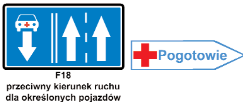
Rys. Znak F-18 i znak 6.3.3.5 „Drogowskaz do pogotowia ratunkowego”

Powyższe rozporządzenie ministra infrastruktury wprowadza do użytku dwa dalsze znaki z czerwonym krzyżem. Są to znaki F-18 „przeciwny kierunek ruchu dla określonych pojazdów” oraz znak „Drogowskaz do pogotowia ratunkowego”. Oba wymienione znaki nie występują w konwencji wiedeńskiej o ruchu drogowym, więc ich użycie łamie postanowienia art. 38 i 44 pierwszej konwencji genewskiej.