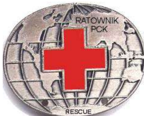
Rys. Odznaka Ratownik PCK