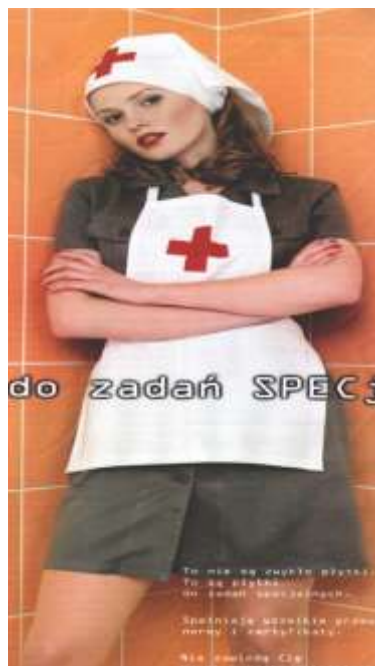
Rys. Uzurpacja znaku czerwonego krzyża