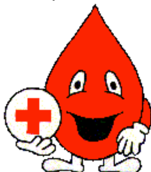
Rys. Kropelka Czerwonokrzyska

Znakiem często używanym w ruchu HDK PCK jest kropelka trzymająca znak czerwonego krzyża. Kropelkę należy traktować jak opisane powyżej logo akcji. Wraz z kropelką musi występować zawsze napis „Polski Czerwony Krzyż”, wykonany czcionką firmową. Może być umieszczana na dowodach uznania związanych z honorowym krwiodawstwem jednak nie powinna się pojawiać na materiałach biurowych.