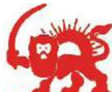
Rys. Czerwony lew i słońce

Po zakończeniu wojny Turcja nie zrezygnowała jednak z używania znaku, domagając się jego uznania przez międzynarodowe konferencje dyplomatyczne w latach 1899 i 1907. W czasie trwania konferencji dyplomatycznej w 1906 roku Persja (dzisiejszy Iran) zgłosiła wniosek o uznanie znaku ochronnego – czerwonego lwa i słońca na białym tle.