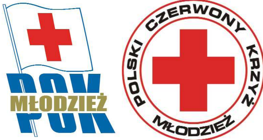
Rys. Stary i nowy znaczek Młodzieży PCK.

Prawo do posiadania własnego znaku daje ruchowi młodzieżowemu Regulamin. Artykuły 16 i 17 określają zasady posługiwania się znakiem przez młodzież. W dokumentach PCK status znaku MPCK uregulowany został w Załączniku do uchwały KRR 23/2003 z 28 czerwca 2003 roku „Struktury i zasady działania ruchu młodzieżowego PCK”. W rozdziale 1 pkt 4 znajduje się przepis mówiący, że znakiem organizacyjnym MPCK jest znak czerwonego krzyża na białym tle w obwódce z napisem „Młodzież Polskiego Czerwonego Krzyża” lub „Młodzież PCK”. W chwili obecnej funkcjonują dwa znaczki Młodzieży Polskiego Czerwonego Krzyża. Starszy, wyemitowany w grudniu 1973 roku (zgodnie z zezwoleniem Ministra Spraw Wewnętrznych Nr D. 448/S/XI/72) i nowy zatwierdzony wyżej wymienioną uchwałą KRR.