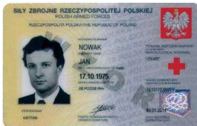
Rys. Karta tożsamości „żółta”