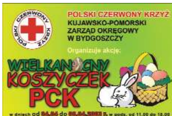
Rys. Logo zaprojektowane przez Oddział Okręgowy

Oddziały lub jednostki podstawowe mogą tworzyć własne logo dla akcji o zasięgu lokalnym z wykorzystaniem znaku Polskiego Czerwonego Krzyża, ale zawsze z poszanowaniem Regulaminu.