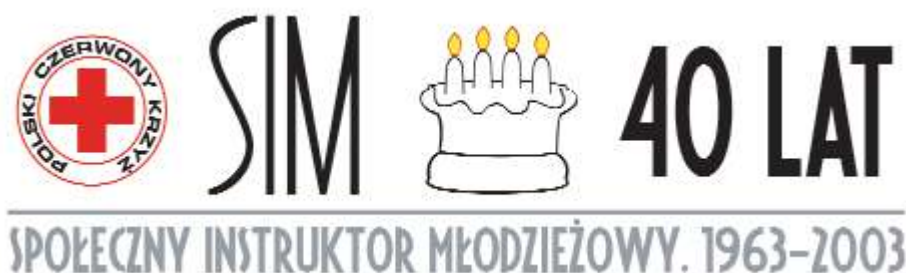
Rys. Logo 40 – lecia Ruchu SIM

Polski Czerwony Krzyż prowadząc swoje akcje i programy używa logo dotyczących każdej z akcji. Obok logo akcji wykorzystywany jest znak Polskiego Czerwonego Krzyża lub, jeśli akcja ma charakter międzynarodowy, znak czerwonego krzyża.