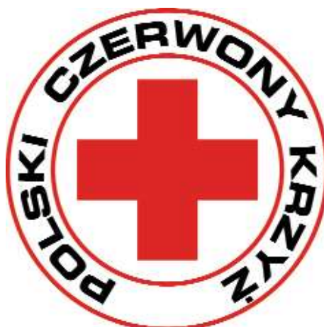
Rys. Znak Polskiego Czerwonego Krzyża

W Polsce, podobnie jak w wielu krajach, na znak składa się krzyż oraz napis wokół niego w dwóch obręczach. Krzyż składa się z dwóch równych ramion, przecinających się prostopadłe pośrodku. Krzyż składa się z 5 identycznych kwadratów. Aby opisać konstrukcję i wzajemne odległości poszczególnych elementów znaku wyznaczamy wielkość „x” równą wysokości jednego kwadratu. Czerwony kolor krzyża uzyskiwać należy poprzez stosowanie farby drukarskiej Pantone 485 3 . Przy druku czarno-białym należy starać się, aby krzyż nie był czarny, a jasno-szary 4 . Tło jest białe. Napis wykonany jest czarną ( Panteon Black 6 ) czcionką Square bold extended z podwójnymi odstępami pomiędzy wyrazami.