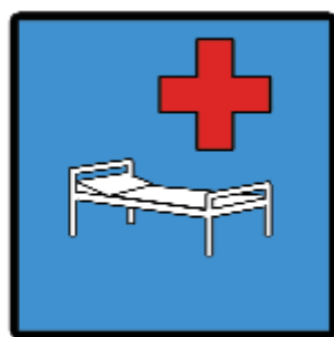
D-21 - Szpital

W polskim prawie występują cztery znaki drogowe, które używają znaku czerwonego krzyża. Są to znaki określone w załączniku do rozporządzenia ministrów infrastruktury oraz spraw wewnętrznych i administracji z 3 lipca 2003 roku (Dz. U. nr 220 poz. 2181). Znaki te występują pod nazwami: D-21 „szpital”, D-22 „punkt opatrunkowy”, F-18 „przeciwny kierunek ruchu dla określonych pojazdów” oraz znak „Drogowskaz do pogotowia ratunkowego”. Tylko pierwsze dwa znaki zgodne są ze znakami zawartymi w Konwencji o ruchu drogowym sporządzonej w Wiedniu dnia 8 listopada 1968 roku (Dz. U. 1988 nr 5 poz. 42 (K)).