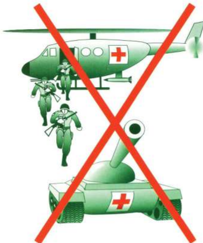
Rys. Wiarołomstwo (perfidia)

Wiarołomstwo (perfidia) to poważne naruszenie międzynarodowego prawa humanitarnego. Wiarołomstwem jest korzystanie ze znaku czerwonego krzyża/czerwonego półksiężyca/czerwonego kryształu dla ochrony zdrowych żołnierzy (kombatantów) lub sprzętu wojskowego. Zabrania tego międzynarodowe prawo humanitarne (PD I, art. 37, 38, 85 ust. 3, lit. f). Statut Międzynarodowego Trybunału Karnego traktuje takie naruszenie jako zbrodnię wojenną 7 . W prawie polskim takie działania podlegają karze na podstawie art. 126. § 1. kodeksu karnego: „Kto w czasie działań zbrojnych używa niezgodnie z prawem międzynarodowym znaku Czerwonego Krzyża lub Czerwonego Półksiężyca, podlega karze pozbawienia wolności do lat 3”.