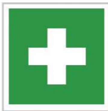
Rys. Znak do oznaczania przedmiotów związanych z pierwszą pomocą (biały krzyż na zielonym tle)

Unia Europejska przyjęła Dyrektywą Rady nr 92/58/EWG specjalny znak na oznaczenie przedmiotów w miejscu pracy związanych z udzielaniem pierwszej pomocy. Rozporządzenie Ministra Pracy i Polityki Socjalnej z dnia 26 września 1997 r. w sprawie ogólnych przepisów bezpieczeństwa i higieny pracy (Dz. U. Nr 129, poz. 844) wdrożyło tę dyrektywę do prawa polskiego oraz nakazało stosowanie normy dotyczącej wyglądu takich znaków (PN-93/N-01256/03). Znak ten i jemu pokrewne używane są do oznaczania: apteczki, punktu pierwszej pomocy, noszy, telefonu alarmowego. Stosowanie tego znaku również poza miejscami pracy pozwoliłoby uniknąć wielu nadużyć związanych z oznaczaniem apteczek czy punktów pierwszej pomocy.